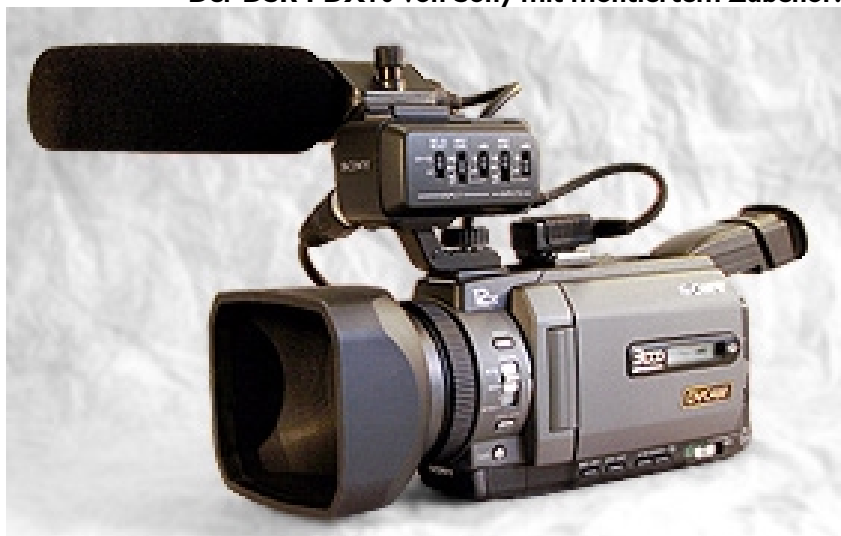
Der DSR-PDX10 von Sony mit montiertem Zubehör.

Consumer- und der Profi-Version sind im Kasten »Unterschiede: DSR-PDX10P und DCR-TRV950« aufgeführt. Drei CCDs sorgen im PDX10 für die Bilder. Die Besonderheit dabei: Es handelt sich um