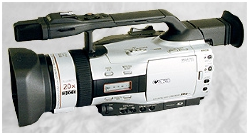
Der Canon XM2: klassisches »Henkelmann«-Design.

Der DSR-PDX10 ist bauphänlich zum Consumer-Camcorder DCR-TRV950 von Sony, letztlich basiert er also auf diesem Gerät und wurde für den professionellen Einsatz etwas abgewandelt. Die Unterschiede zwischen der