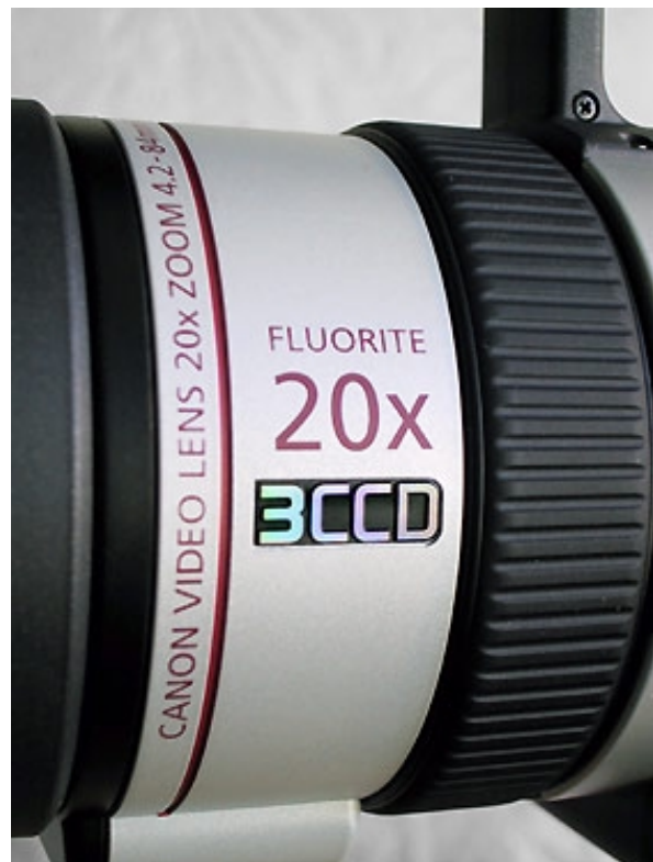
Das relativ weitwinklige 20fach-Zoom des Canon XM2 ist eines der Top-Features dieses Camcorders, das ihn von den Konkurrenten unterscheidet.

Mit einem Problem kämpfen indes beide Camcorder gleich stark: Ist bei Camcordern mit größeren CCDs neuester Bauart das Thema Smear nahezu passé, lassen sich bei den Semiprofis mit ihren kleinen Bildwandern leicht die vertikalen Störstreifen provozieren, wenn man Punktlichtquellen im