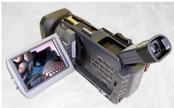
Der Ausklapp-Bildschirm des PDX10 ist mit einer Diagonalen von 8,8 cm größer als sonst bei Camcordern diese Bauart und Größe üblich.

Ein mit 8,8 cm Bilddiagonale vergleichsweise groß dimensionierter Ausklapp-Bildschirm ziert den PDX10. Das LC-Display bietet 1.120 x 220 also 246.400 Bildpunkte, das ist mehr, als bei Consumer-Camcordern bislang üblich. Weil der Schirm als Touch-Screen ausgeführt ist, lassen sich etliche Menü-Funktionen des PDX10 direkt auf dem Schirm antippen.