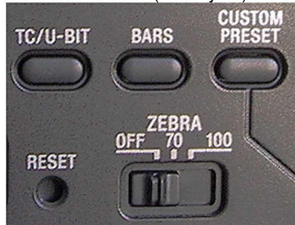
Timecode und Userbits lassen sich beim PDX10 frei setzen. Farbbalken und Zebra lassen sich direkt zuschalten, ohne über Einstellmenüs gehen zu müssen.

die hier verwendbaren Sony-Speichermedien schreibt der Camcorder Standbilder mit bis zu 1.152 x 864 Bildpunkten oder MPEG-1-Filme mit einer Auflösung von maximal 320 x 240 Pixeln. Zudem gibt der Camcorder Bild und Ton auch als Streaming-Files über den USB-Anschluss ab (Motion-JPEG).